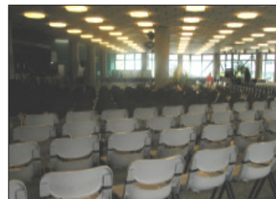
Konzertbestuhlung im Gebäude HPH

Standorte und Anreise Unterrichts- und Sitzungsräume ETH Zürich Grundrisspläne der ETHZ-Gebäude Event Organisation